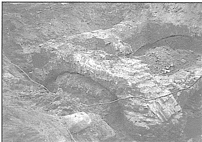
II. 2. Fundamenty budynku nr 2 odsłonięte w 2000 roku - narożnik południowo - wschodni